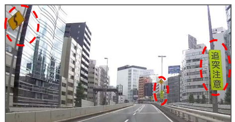
S字カーブと追突注意