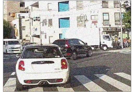
危険に満ちた右折シーン

右折は、運転の中でも、特に注意を要する難しい行動です。この右折に、多くのドライバーが、初心者のころは大変緊張したにも関わらず慣れが生じると、いつしか、その危険性を過小評価するようになってはいないでしょうか。今号は、重大事故が後を絶たない右折について、改めてその危険性や走行の基本などを取りあげましたので、是非、自身の「右折」行動をチェックする参考としてください。