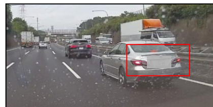
②後続車がブレーキ