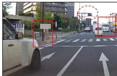
①信号が赤色になり、歩行者もいますが・・・

安全運転に大事なことは、このような運転者がいることを想定して運転すること、遭遇した際には、冷静に対処することです。