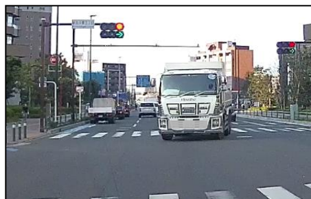
③通過後、対向車がようやく右折