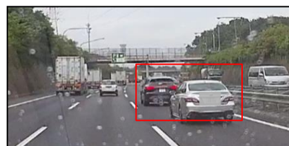
③車間距離不保持の状態を追走